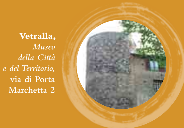
Vetralla, Museo della Città e del Territorio, via di Porta Marchetta 2