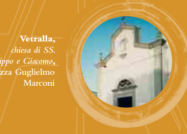
Vetralla, chiesa di SS. Filippo e Giacomo, piazza Guglielmo Marconi