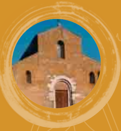
Vetralla, chiesa di San Francesco, Largo San Francesco